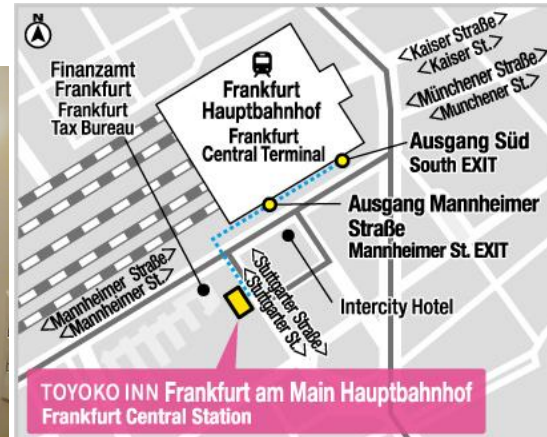
TOYOKO INN Frankfurt am Main Hauptbahnhof Frankfurt Central Station